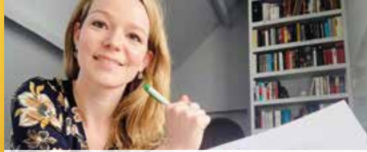
Kwaliteitsplan Malle goedgekeurd (p. 2)