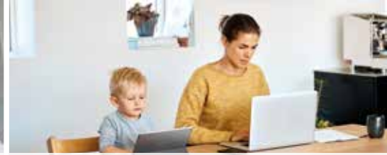
Digitale kloof in Malle verkleinen (p. 3)