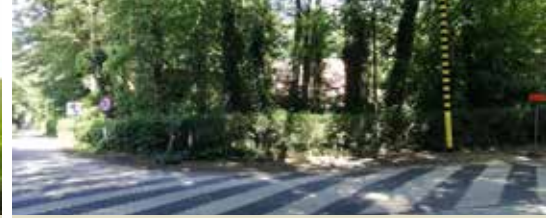
Nieuwe mobiliteitsinitiatieven op een rijtje (p. 3)