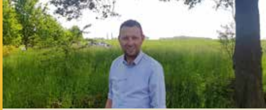
Gemeente legt onderzoek stortplaats voor aan OVAM (p. 2)