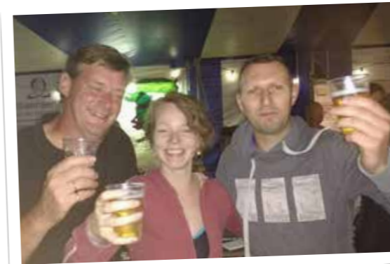
▲ Met enkele deelnemers die de uitdaging van de 300 meter zwemmen, 18 kilometer fietsen en 4 kilometer lopen aangingen, laat N-VA Malle zich van haar sportieve kant zien op de recreatieve triatlon van buurtvereniging De Lollepotters.

Hopelijk heeft u een stukje kunnen meegenieten van de activiteiten waarmee Malle afgelopen zomer uw zomer opfleuren.