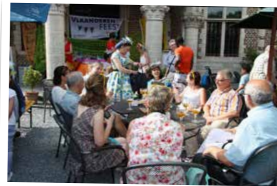
▲ N-VA Malle kleurt de 11 juli-viering traditiegetrouw geel.