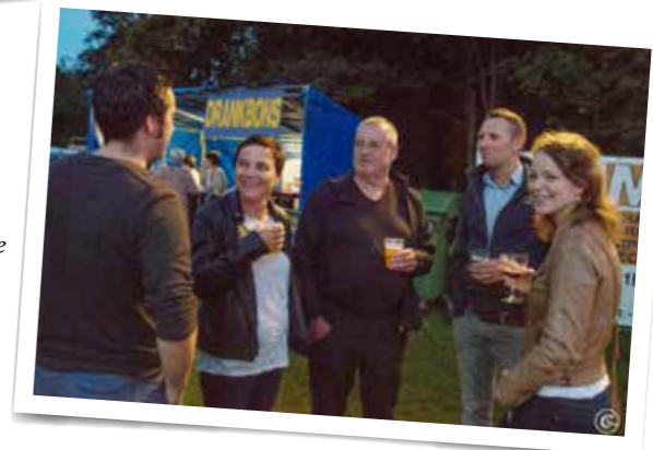
► Tegen de achtergrond van een uniek decor kon u de vijf laatste donderdagen van de zomervakantie genieten van muziek aan 't kasteel De Renesse.